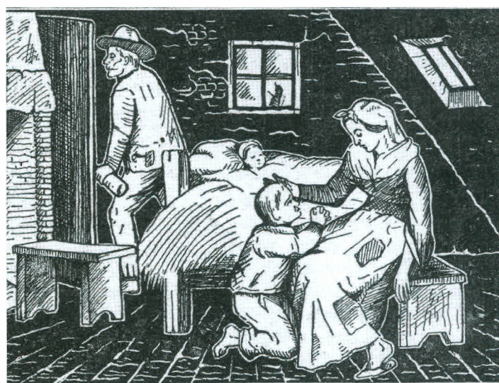
Prent van Sobriëtas, met onderschrift: "Neen moeder, ik nooit. Geen druppel". Een veel gebruikt argument van drankweerverenigingen was dat alcoholmisbruik het gezinsleven kapot maakt. Op veel prenten (zoals in dit voorbeeld) is dan ook te zien hoe een dronken vader zijn vrouw en kinderen verwaarloost.

De leden van de lokale afdelingen van de League konden wekelijks of maandelijks stichtelijke lezingen over het alcoholvraagstuk bijwonen, al dan niet in combinatie met een tea party .