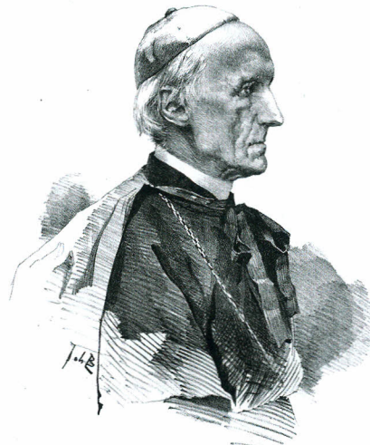
Kardinaal Manning door J.C. Braakensiek, uit: de Amsterdammer , 1890.