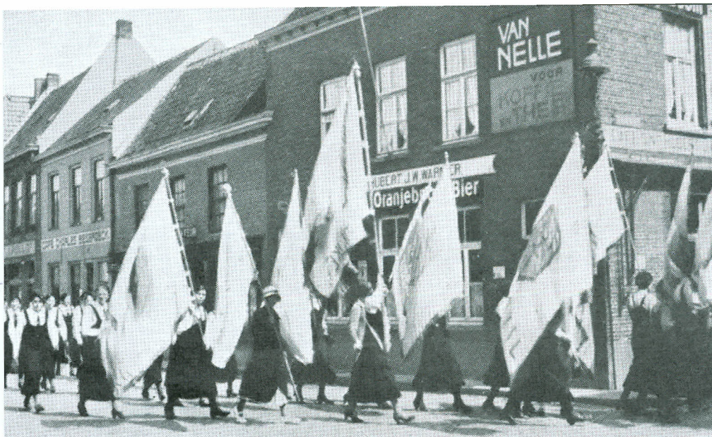
Jeugdmars te Hulst (Zeeland), 26 mei 1935. Sobriëtas organiseerde optochten en manifestaties ter promotie van de 'drankweer' naar Brits voorbeeld.