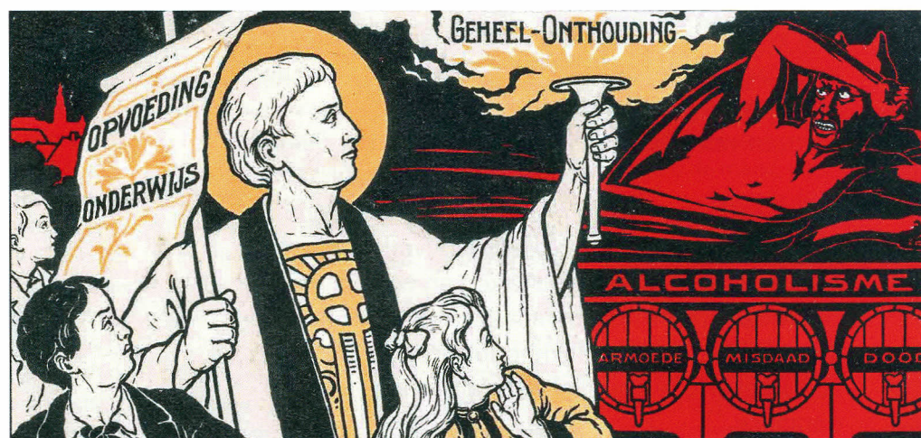
Prent van Sint Cassianus (Den Bosch) met als bijschrift: “Geheel-onthouding is het beste middel om het volgende geslacht te vrijwaren voor het alcoholisme.” Het argument was dat alcohol zou leiden tot armoede, misdaad en de dood; en dus een instrument was van de duivel. Deze boodschap was veelal gericht op de jeugd.

Dit is een verkorte en bewerkte versie van de Ariëns Lezing, die Chris Dols op 22 april 2022 gaf. De lezing werd georganiseerd door het Alfons Ariëns Comité en vond plaats bij het KDC.