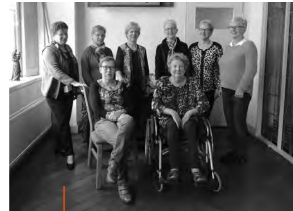
De PCI werkgroep Gaanderen

Op eenzelfde manier zetten de werkgroepleden zich bij veel activiteiten in waar helpende handen worden gevraagd. Te denken valt aan de Mariapassie, de Levende Kerststal, het Goede Vrijdagconcert en het bedankfeest voor alle vrijwilligers. De werkgroep PCI zorgt dan bijvoorbeeld voor drinken en een broodje. Ook bij het verzorgen van inspiratievieringen bieden