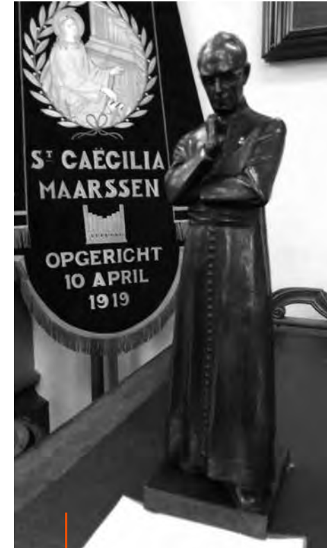
Ariënsbeeld gemaakt door Bon Ingen-Housz in 1937 en vaandel van St. Caecilia koor in Maarssen